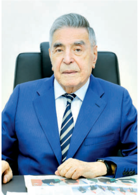
Оқил САЛИМОВ, академик